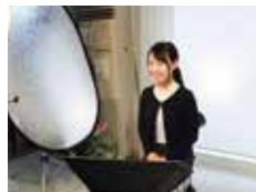
山手フォトスタジオの証明写真専用スタジオ。めずらしい下からのライティングがある。

生き生きとした表情を出すにはライティングも重要。撮影後の写真調整をしてもらえるかチェック。