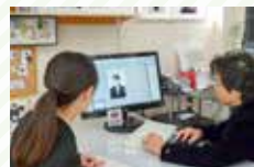
髪の色も調整可能。何でも気軽に相談しよう!

撮影後、目の前で、後れ毛や気になるニギビ跡を消して、自然に整えてもらえる。モニターで自分の表情を確認した後、表情が良くなければ撮り直しをすることも。写真はその日にお渡し(10~15分後)。ぜひ事前に予約を。